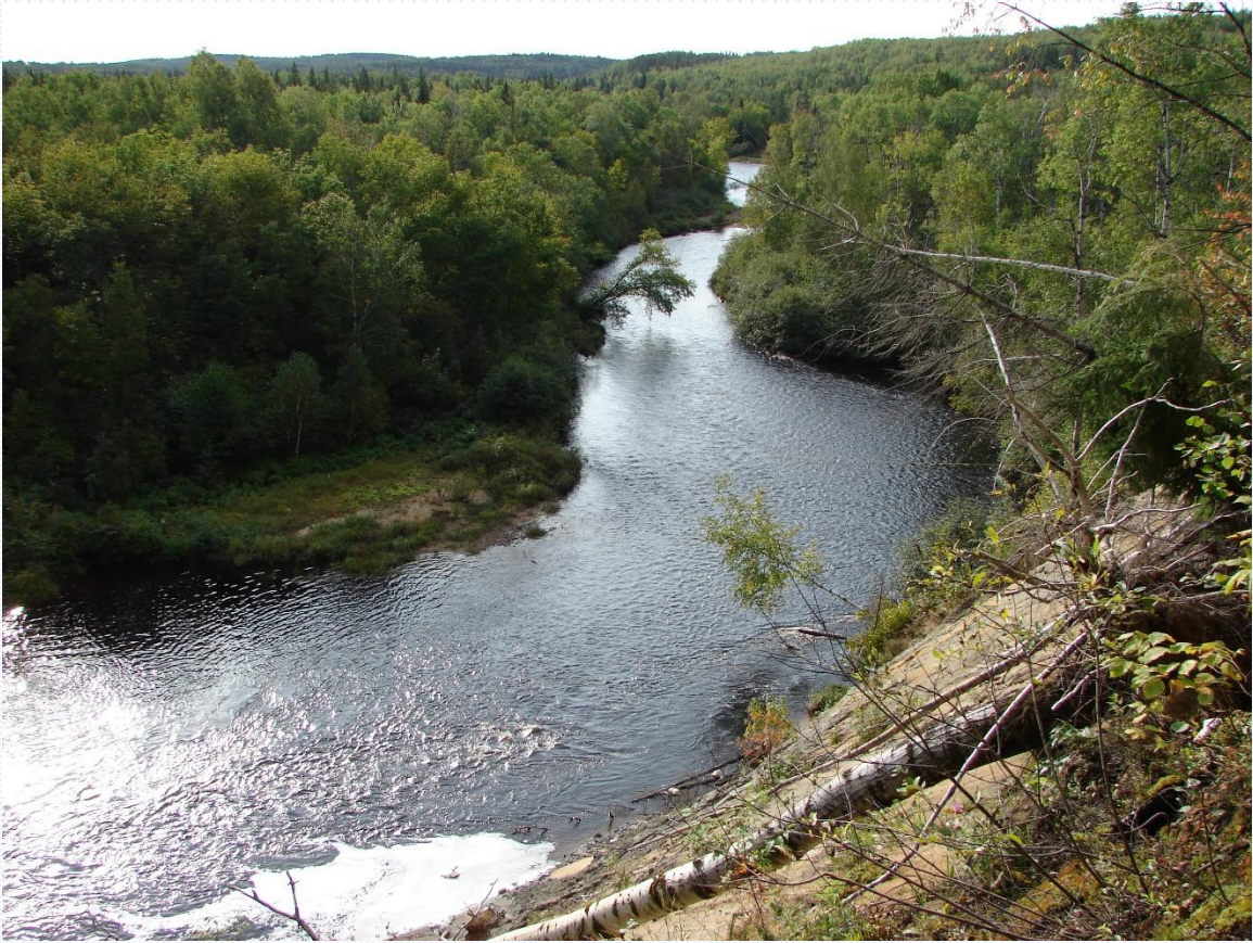
Moulin des Pionniers